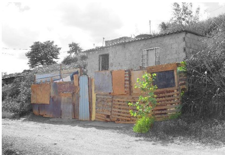
Imagem 5: edição de figura padronizada de acordo com o inventário natural-cultural, ressaltando os inventos (vedação externa) e a natureza (muda plantada)