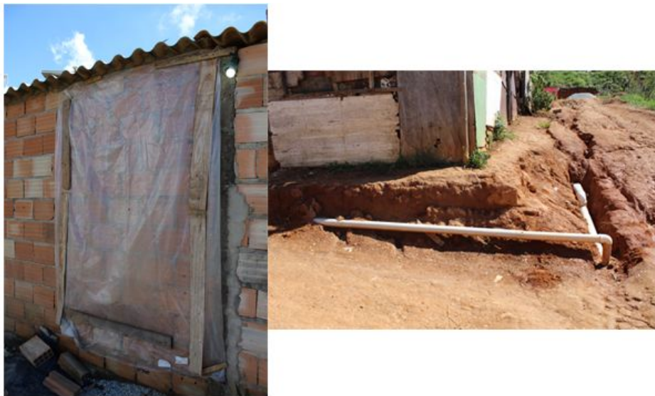
Imagem 3: Precariedades mapeadas no território

Em relação ao material coletado, prática comum nas ocupações autoconstruídas, o mapeamento identificou uma variedade grande (portas, janelas, pallets, madeirites, vasos sanitários, pedras de granito, divisórias, etc), que são encontrados pelos moradores nas ruas e caçambas das redondezas. Aqueles materiais que estão em melhor estado são procedentes de doações de empresas da região. Esses materiais podem tanto ser utilizados para aquela função que foram produzidos, e, não raro, podem ser transformados e ressignificados (Imagem 4), como por exemplo um guarda-roupa transformado em vedação, latas de tinta em vasos de plantas e pneus que são usados como contenção, etc..