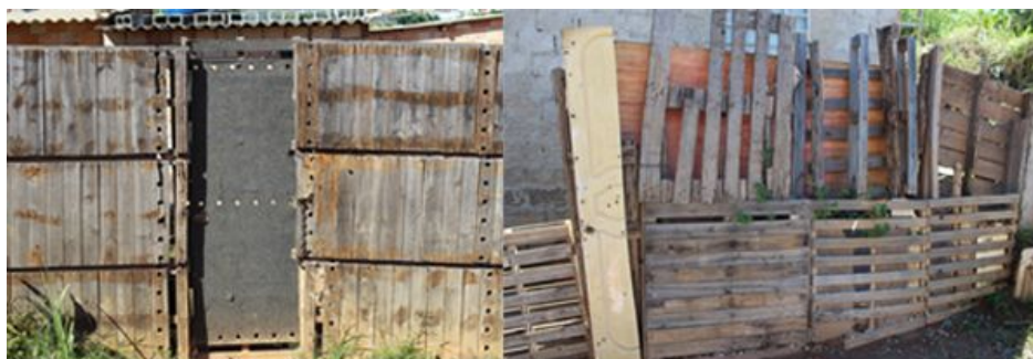
Imagem 4: Inventos mapeados no território

(imagens coletadas durante mapeamento realizado na ocupação Paulo Freire em 19/05/2019)