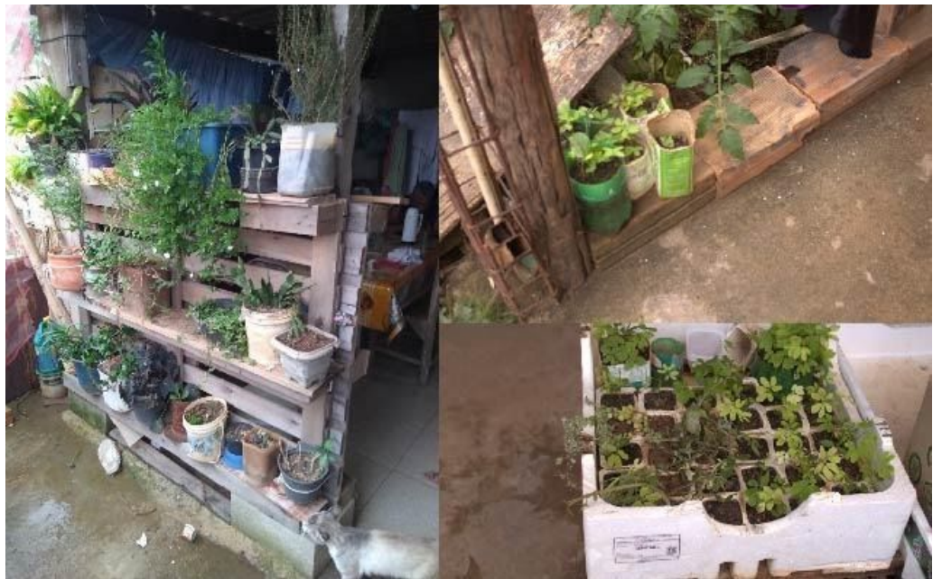
Imagem 2: jardins particulares

aqueles que, de alguma forma, as pessoas se engajam pessoalmente e constroem uma relação com os não-humanos, não necessariamente por meio de políticas públicas, e que promovem o encontro e o reconhecimento. Através de um mapeamento, baseado na observação participante dos jardins e em entrevistas de caráter etnográfico, iniciou-se o entendimento sobre os elementos não-humanos como plantas, animais, água, solo, nesse território e seu relacionamento com os humanos. Os dados apresentados a seguir são preliminares e se baseiam nas entrevistas realizadas pelos pesquisadores.